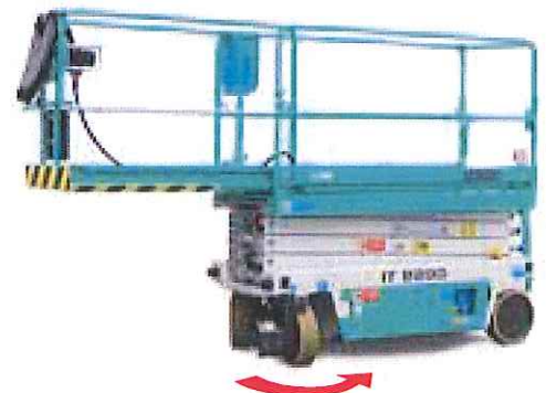
Extensión manual de la plataforma 1,4 m