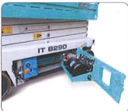
El lógico montaje de los componentes facilita la manutención.